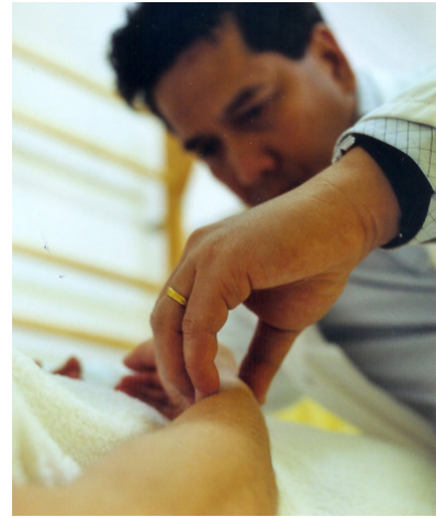
Prof. Sofyan Rangkuti

Soms is een arts of specialist uitbehandeld, terwijl een patiënt nog altijd met pijn rondloopt. Ook zijn er tal van 'onverklaarbare aandoeningen' zoals extreme vermoeidheid en depressie waarbij patiënten een lang (soms alternatief) behandeltraject volgen, niet altijd met een oplossing. Prof. Sofyan Rangkuti ontdekte dat hij door de kennis van Chinese geneeskunde met westerse geneeskunde te integreren een nieuwe methode kon ontwikkelen waarmee hij juist die mensen uitkomst kan bieden. Rangkuti presenteerde zijn nieuwe methode op het Internationale symposium Integration of Eastern & Western Medicine dat op 23 en 24 september werd gehouden in het Dorint Sofitel hotel op Schiphol.