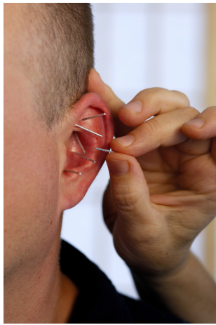
Microsysteem: het oor

De nieuwe behandelmethode is verder gebaseerd op de toepassing van verschillende microsystemen bij de behandeling van klachten. Tijdens de afgelopen vijf jaar deed Rangkuti uitgebreid onderzoek naar de relatie tussen de hersenen en de buikregio, de bekkenbodem (perineum) en het oor. Vanuit gebieden in de buik zijn bepaalde gebieden in de hersenen te stimuleren of te beïnvloeden. Het gebied bij de navel is